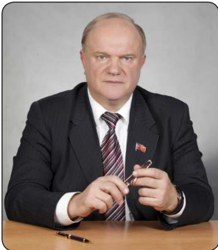
Уважаемые соотечественники! Товарищи! Друзья!

ПОРА ЗНАТЬ ПРАВДУ! Издаётся с 19 января 1994 года