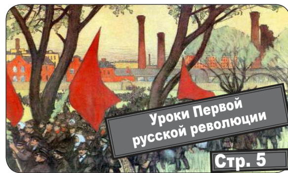
Уроки Первой русской революции Стр. 5

www.kprfast.ru официальный сайт коммунистов Астраханской области