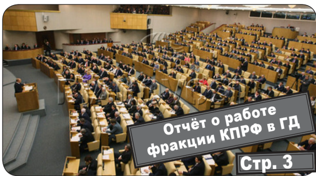
Отчёт о работе фракции КПРФ в ГД Стр. 3