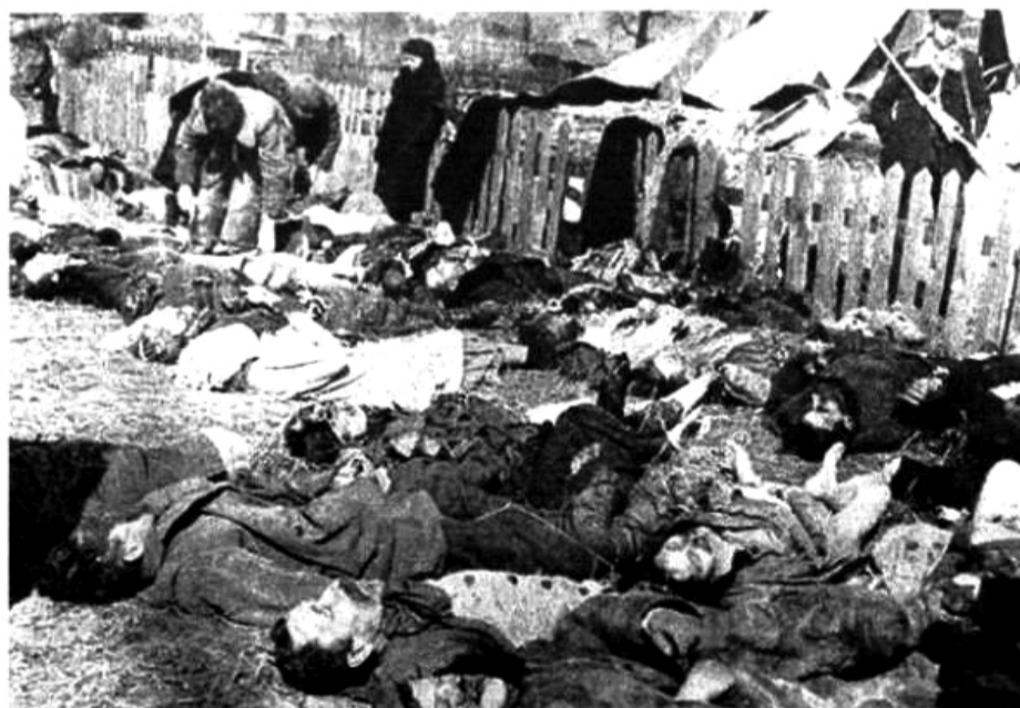
Трупы жителей деревни Липники на Воляни. 26 марта 1943г. активисты УПА убили 182 человека

21 ноября 2014 года на заседании Третьего Комитета 69-й Генассамблеи ООН в очередной раз обсуждался проект резолюции, которую представила Россия.