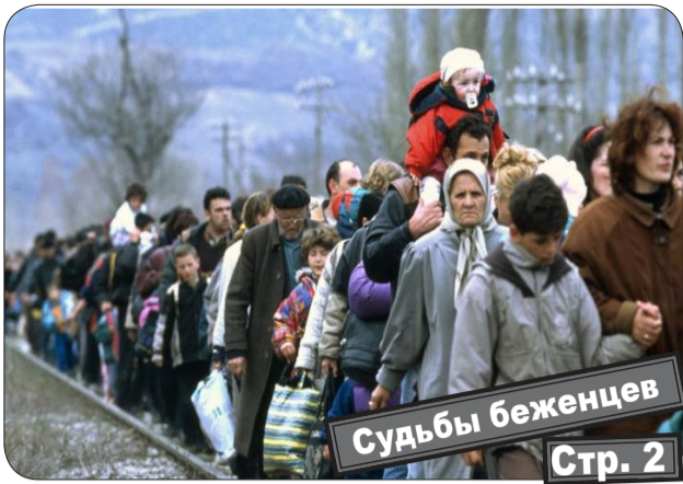
Судьбы беженцев Стр. 2