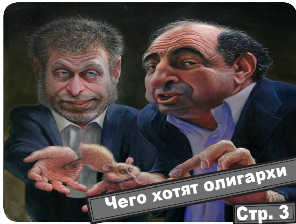
Чего хотят олигархи Стр. 3