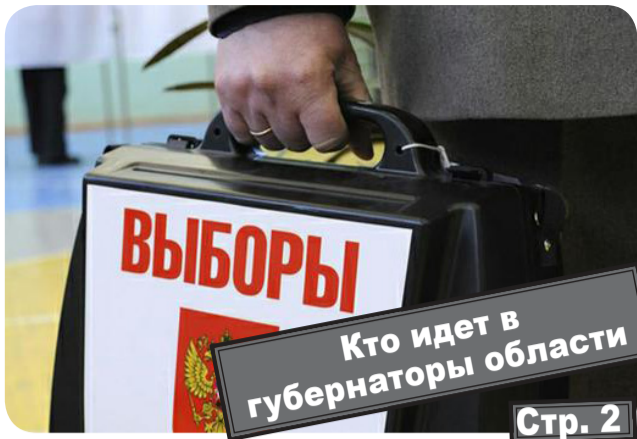
Кто идет в губернаторы области Стр. 2