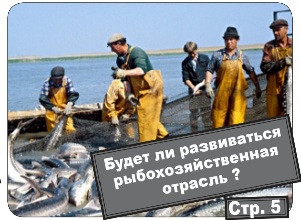
Будет ли развиваться рыбохозяйственная отрасль? Стр. 5

www.kprfast.ru официальный сайт коммунистов Астраханской области