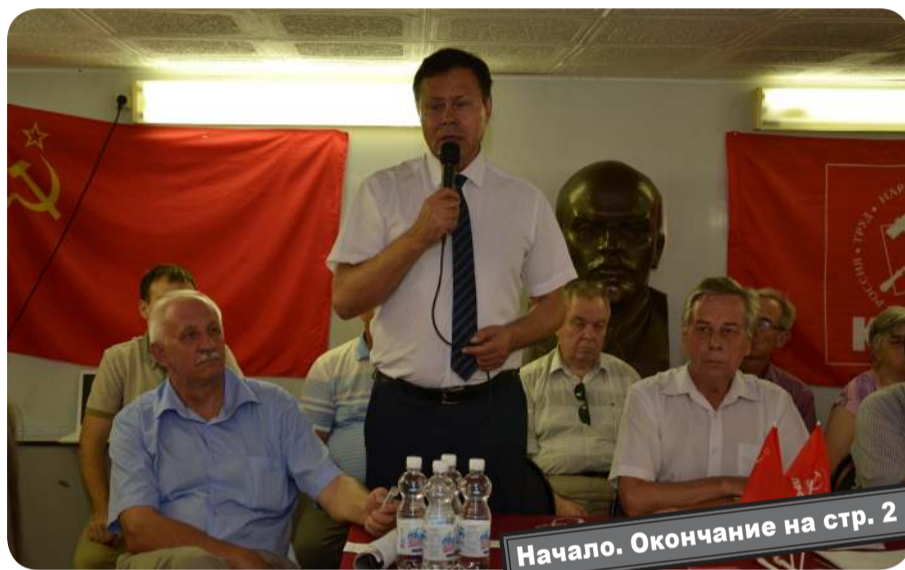
Начало. Окончание на стр. 2

22 июня прошел 1-й этап 46-й Конференции Астраханского областного отделения КПРФ. Главным вопросом на этом этапе стало выдвижение кандидата на выборы Губернатора Астраханской области, а также кандидатов на должности глав муниципальных образований – там, где выборы уже назначены.