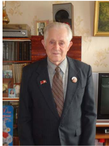
на территорию Советского Союза фашистско-немецких захватчиков?

- Это вероломное нападение на нашу Родину. Гитлер хотел завоевать весь мир. Но его планы не осуществились: победил Советский Союз, так как руководил тогда им Сталин, потому