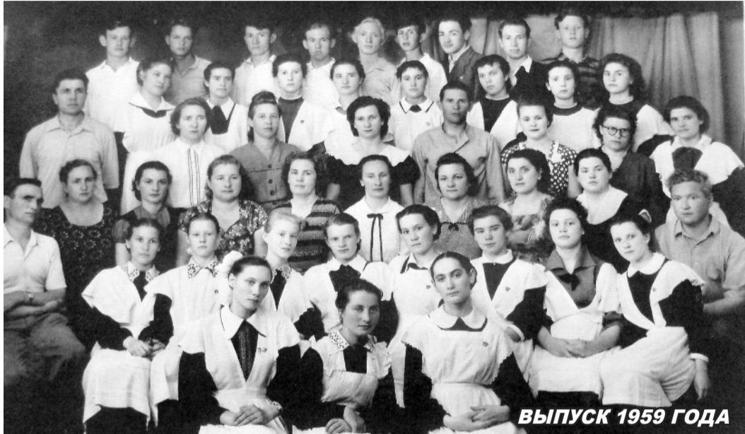
ВЫПУСК 1959 ГОДА

А годы летят! Невыразимо быстро летят дни, месяцы, годы. Чем больше их осталось за спиной, тем бережнее и с большей нежностью относишься к ним.