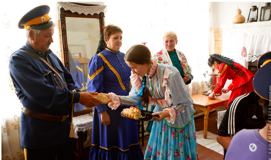
13 декабря посчастливилось вместе с ветеранами общественных организаций по защите прав и законных интересов ветеранов труда и пенсионеров Астраханской области и «Дети войны» побывать на экскурсии в станице Копановка (Енотаевский район).

По дороге экскурсовод сообщила много интересного из истории тех мест, по которым проезжали. В самой станице нас встретили красивые женщины в традиционных русских нарядах и очень вежливые дети. Особенно приятно было смотреть на мальчишек, с гордостью носящих казацкую форму.