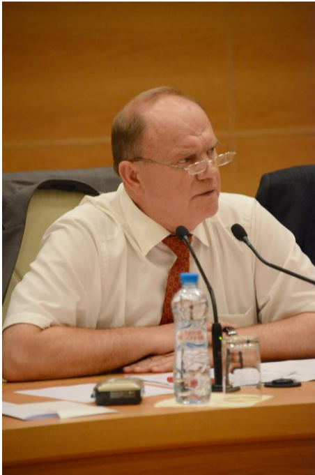
Коммунисты запускают процедуру выражения недоверия правительству. Об этом 1 июля на заседании фракции КПРФ в Госдуме рассказал лидер Компартии Г.А. Зюганов.

лагает превращение Академии наук в клуб ученых, - рассказал Геннадий Андреевич. - Вся гигантская собственность, которая ей принадлежит, изымается, туда ставятся «нужные» люди, которые организуют движение финансовых потоков в нужном направлении».